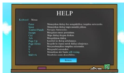
Gambar 5. Informasi

Tampilan di halaman preferences merupakan halaman yang berisi pengaturan Visual Novel.