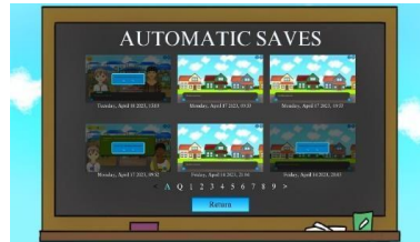
Gambar 3. Load Data

Quit merupakan menu yang digunakan untuk keluar dari aplikasi.