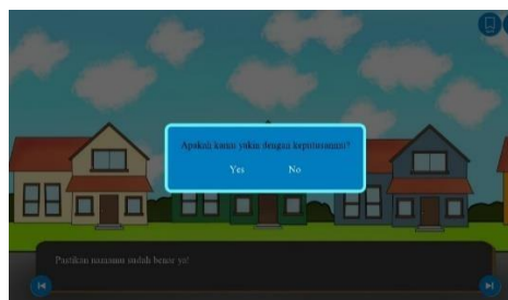
Gambar 6. Halaman Keputusan

Pada halaman help merupakan halaman informasi yang berisi deskripsi petunjuk cara memainkan Visual Novel.