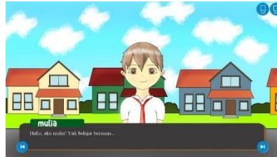
Gambar 7. permainan

Pada halaman keputusan terdapat pilihan fungsi untuk dapat mengambil keputusan dalam Visual Novel seperti konfirmasi nama atau jawaban dan juga untuk pilihan jika ingin keluar dari permainan .