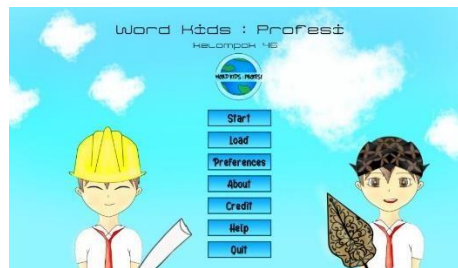
Gambar 2. menu utama