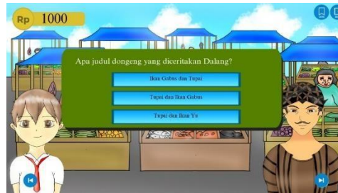
Gambar 10. Halaman pertanyaan

Halaman untuk memilih salah satu dari ke 2 karakter itu dalang atau pengrajin kayu sehingga pemain dapat memilih siapa yang ingin ditemui terlebih dahulu