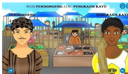
Gambar 9. pemilihan karakter

Halaman untuk memilih salah satu dari ke 2 jalur yaitu pasar atau kompleks. yang dapat dilewati karakter utama untuk sampai kerumah.