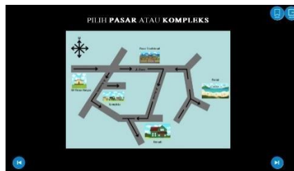
Gambar 8. map

Halaman untuk memilih salah satu dari ke 2 jalur yaitu pasar atau kompleks. yang dapat dilewati karakter utama untuk sampai kerumah.