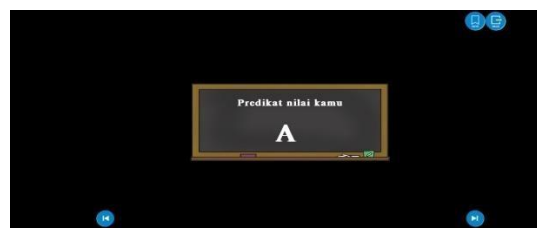
Gambar 12. Halaman Good Ending

Dalam halaman ilustrasi terdapat ilustrasi dari kegiatan yang ada didalam permainan visual novel.