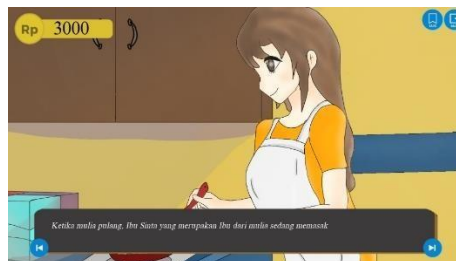
Gambar 11. Halaman ilustrasi

Pada halaman pertanyaan pemain dapat memilih jawaban