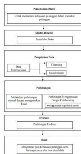
Gambar 1. Tahapan Penelitian