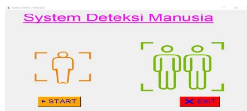
Gambar 3 Implementasi Menu Utama

Impelemtasi tampilan awal program ini digunakan untuk melakukan proses awal sistem diteksi digunakan, jika pengguna melakukan pengklikan tombol star maka sistem akan memulai diteksi manusia untuk keamanan rumah dan jika pengguna melngklik tombol exit maka sistem tidak akan berfungsi. Brikut ini adalah tampilan menu awal sistem deteksi rumah yaitu :