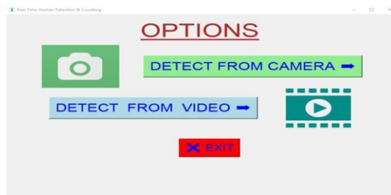
Gambar 4 Implementasi Menu Pemilihan Pengaturan

video maka mengklik menu video. Berikut ini adalah tampilan menu pemilihan pengaturan sistem deteksi rumah yaitu: