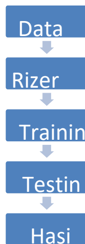
Gambar 1 Tahapan Penelitian

Tahapan-tahapan yang dilakukan dalam penelitian ini dapat dilihat pada gambar di bawah ini :