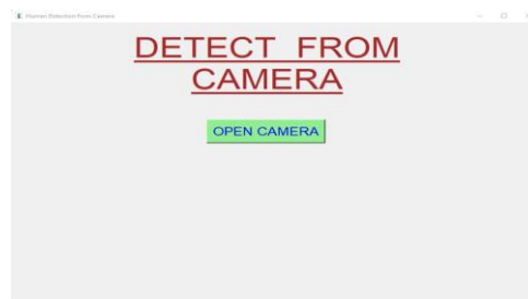
Gambar 5 Implementasi Menu Tampilan Pemilihan Pengaturan

Berdasarkan pemilihan pengaturan yang dilakukan dapat menampilkan tampilan sebagai berikut :