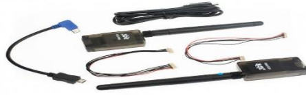
Gambar 3. Modul Radio 3DR

media transmisi datanya, namun menggunakan gelombang radio untuk proses transmisinya (Gita & Setyaningrum, 2018), (Sidiq & Manaf, 2020), (Sulistiani & Aldino, 2020).