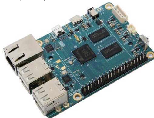
Gambar 1. Odroid C1

Mini PC adalah komputer yang dirancang dalam ukuran kecil, mini PC yang dipakai pada penelitian ini adalah mini PC yang dikeluarkan oleh hardkernel (Suprayogi et al., 2021), (Samanik, 2021), (Fithratullah, 2021).