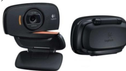
Gambar 2. Logitech C525

Webcam yang digunakan sebagai pengindra digital muatan roket yaitu menggunakan webcam logitech C525 seperti yang terlihat pada gambar 2 berikut (Dakwah et al., 2021), (Robot, 2007), (H Kara, 2014).