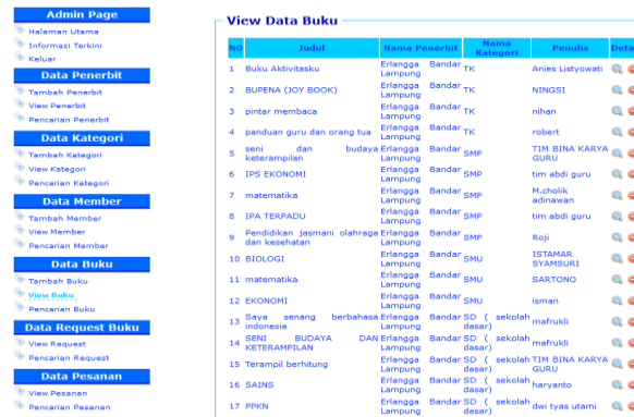
Gambar 5 Tampilan Menu Admin