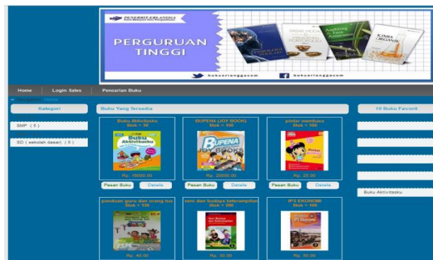
Gambar 3 Tampilan Home